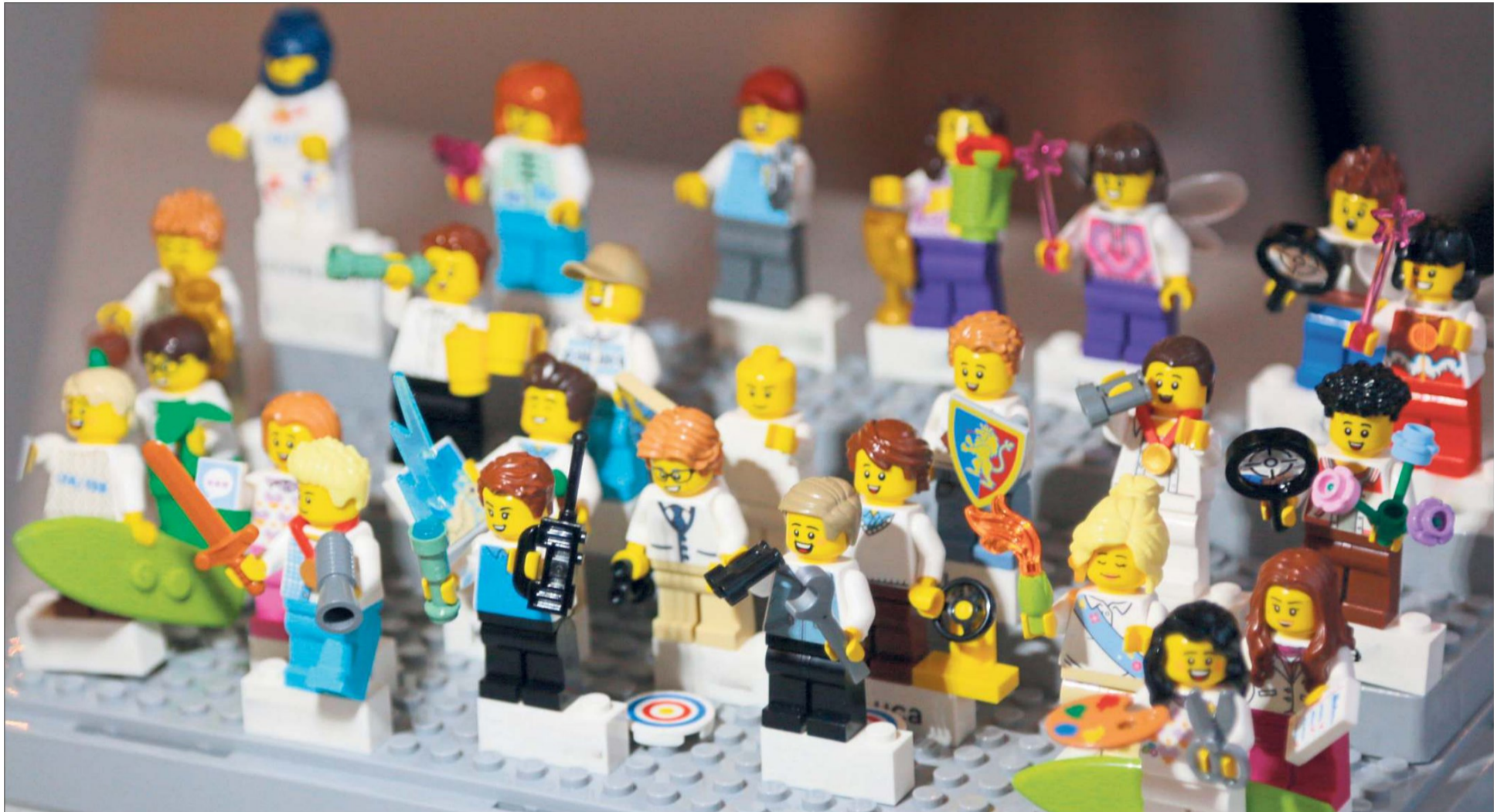
Kreativ reflektiert: Junge Talente visualisieren im Workshop ihre Werte und ihre Weiterentwicklung als Führungskräfte.